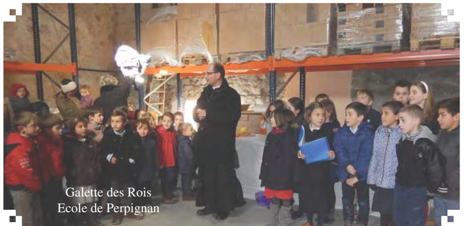
Galette des Rois Ecole de Perpignan