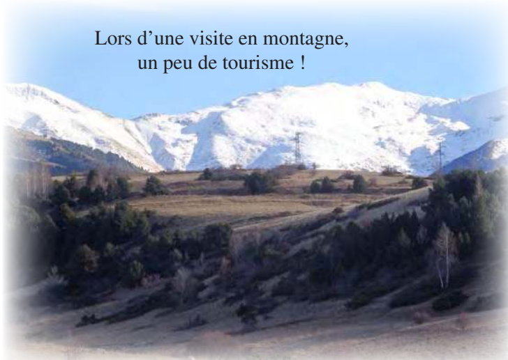
Lors d'une visite en montagne, un peu de tourisme !