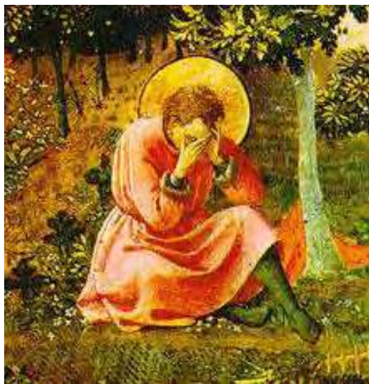
« Conversion de St Augustin », par Fra Angelico : joie de la grâce ou tristesse du péché commis ?