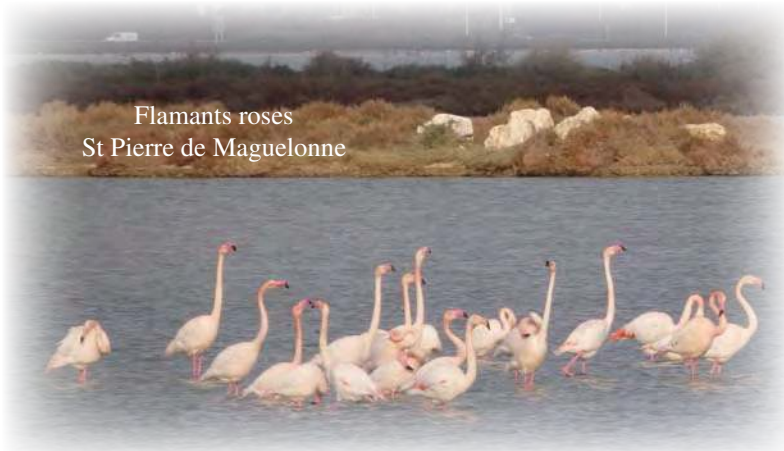
Flamants roses St Pierre de Maguelonne