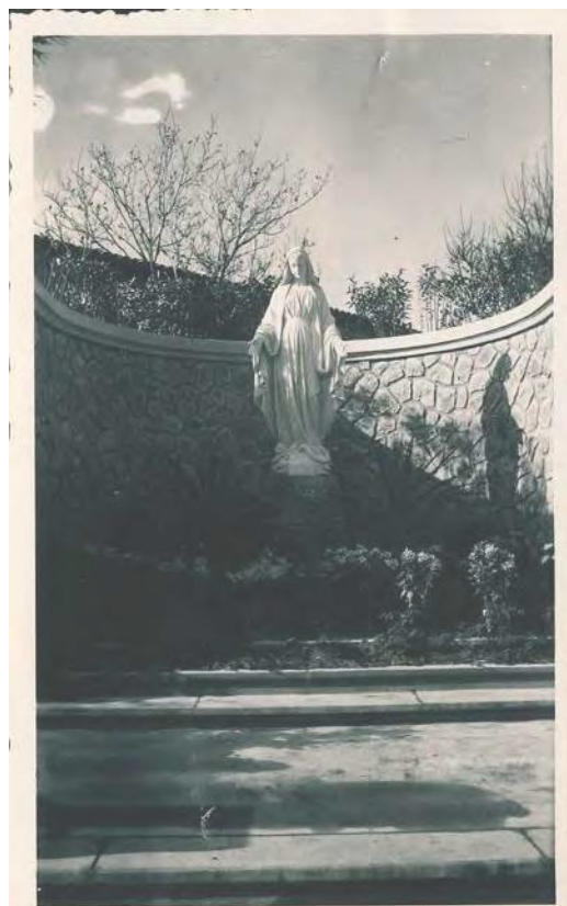
(...) Merci pour la Vierge de la route qui imprime à notre village une image de marque.