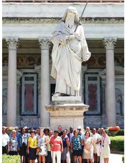
^ Saint Paul-hors-les-murs. Le glaive symbolise à la fois le martyr de l'Apôtre et la Parole de Dieu (Hébreux IV,12)