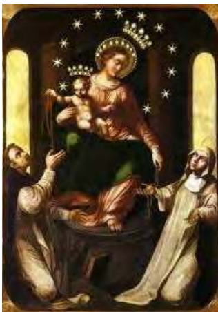
Vierge du Rosaire à Pompéi.