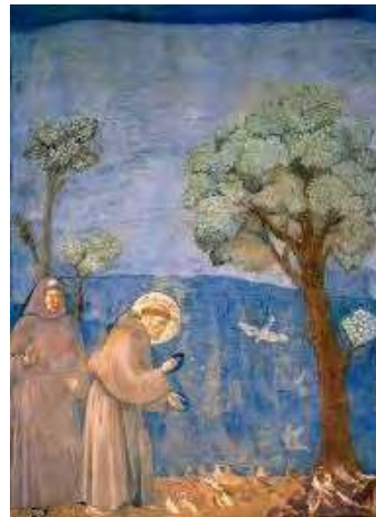
Magnifiques fresques de Giotto dans la basilique supérieure d'Assise