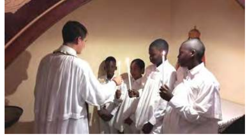
Baptêmes à Pointe-à-Pitre ^

< Basilique Saint François (1182-1226) à Assise où repose le Saint dans la basilique inférieure. v Grotte de l'apparition de Saint Michel.