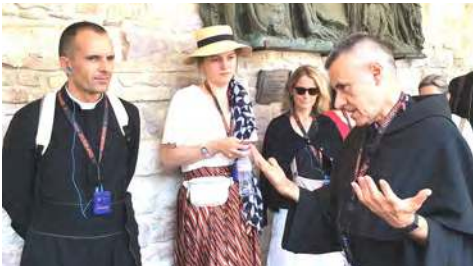
Extraordinaire guide franciscain à Assise.^

< Basilique Saint François (1182-1226) à Assise où repose le Saint dans la basilique inférieure. v Grotte de l'apparition de Saint Michel.