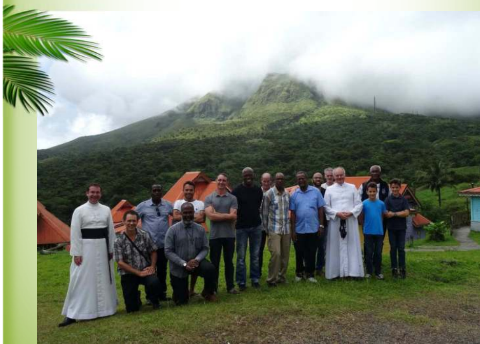
Retraite de saint Ignace pour messieurs au Morne Rouge