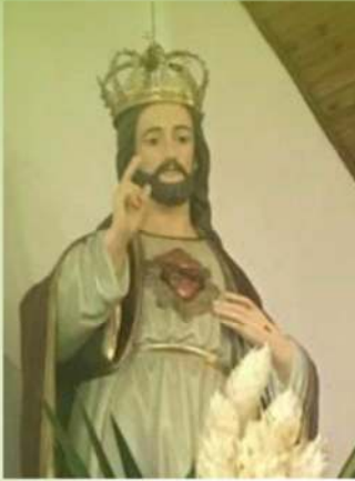
Couronnement du Sacré-Cœur pour le Christ-Roi