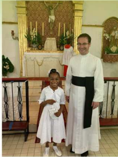
1 ère communion