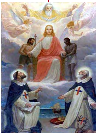
SAINT JEAN DE MATHA, Fête le 8 février

suffisaient déjà plus à son zèle ; dès lors il appliqua toute l'activité de son esprit à sa perfection personnelle et à la direction intérieure de son institut. S'il sortait du couvent, c'était pour aller s'asseoir au chevet des malades