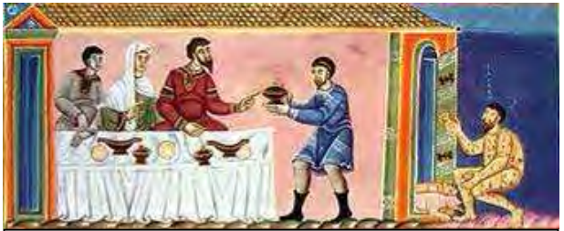
Le mauvais riche et le pauvre Lazare (Luc ch.16)

A l'instant même de notre mort, nous serons jugés par Notre-Seigneur lui-même. Toutes nos pensées, nos paroles et nos actions seront pesées par notre Souverain Juge. Pour le chrétien qui sent sa fin approcher, quel réconfort alors de se rappeler ses bonnes actions, ses sacrifices pour Dieu et le prochain. En revanche quelle angoisse pour celui qui, sans rejeter complètement Notre-Seigneur, s'est contenté de remettre à plus tard ses bonnes résolutions. Nous serons jugés sur des faits : « Ce ne sont pas ceux qui disent : « Seigneur, Seigneur ! » qui entreront dans le Royaume des Cieux mais ceux qui font la volonté de mon Père. ». Si vous lisez ce bulletin c'est que vous aimez le Bon Dieu, que vous aimez aussi le prochain comme vous-mêmes, mais concrètement