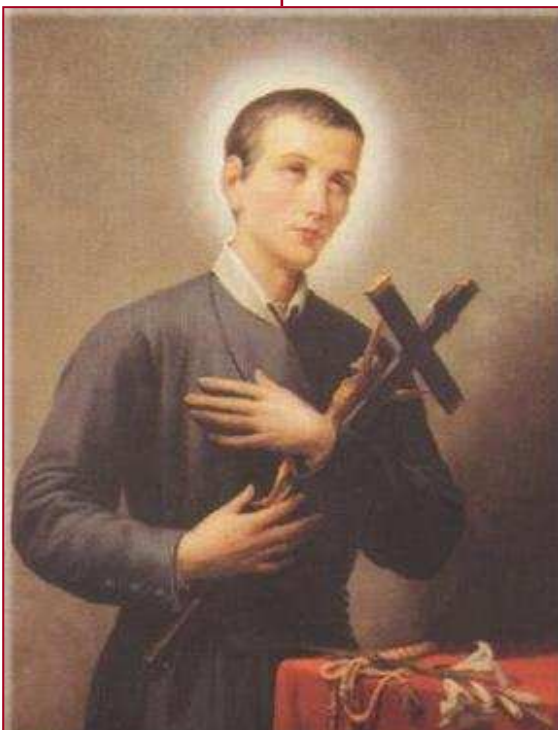
SAINT GERARD, mort à 29 ans Le saint patron du frère

une belle docilité, partout où on le lui demande, tant à la sacristie qu'à la chorale ou au catéchisme, au jardin comme à la cuisine.