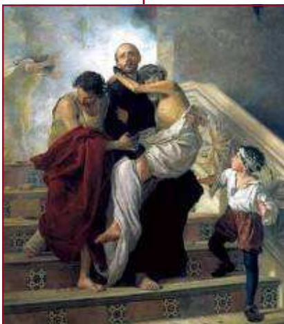
SAINT JEAN DE DIEU 1495-1550 Fête le 8 mars

mourant demanda qu'on lui lût la Passion dans l'Évangile de saint Jean. Cette lecture terminée, il voulut ensuite qu'on le laissât seul. Alors il se leva, revêtit son costume religieux et demeura à genoux un assez long temps. Puis on l'entendit s'écrier : « Jésus, Jésus, je remets mon esprit entre vos mains », et il expira, toujours agenouillé et tenant un crucifix. On retrouva son corps en cette position. C'était le 8 mars 1550. ♦