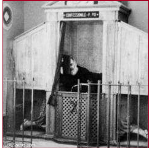
Padre Pio au confessional

C'est pourtant un devoir grave de leur charge que n'ont pas méprisé le Curé d'Ars et le Padre Pio par exemple. Vous avez la grâce d'avoir tous les jours un prêtre à la chapelle le matin, et tous les dimanches avant les messes. C'est devenu un bienfait rare. Alors ne négligez pas ce don de Dieu.