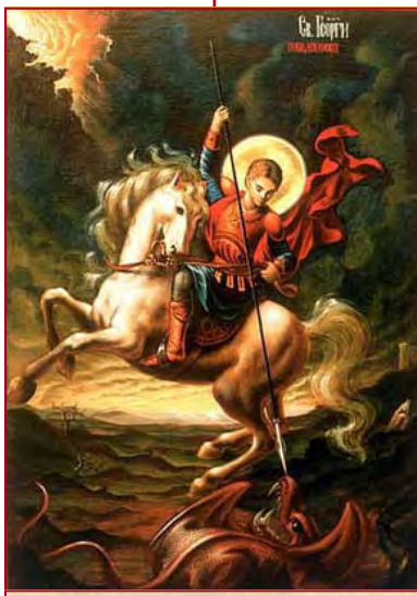
SAINT GEORGES martyr Fête le 23 avril