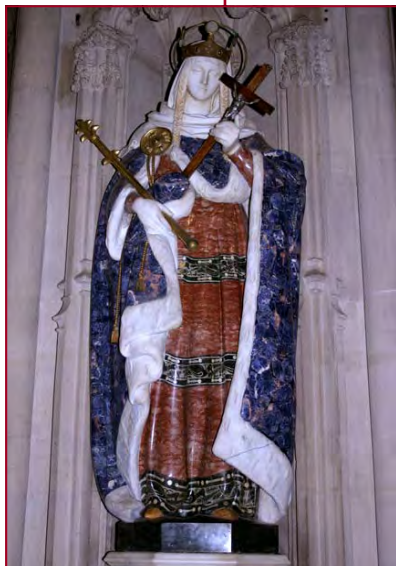
SAINT VINCENT DE PAUL Apôtre de la charité Fête le 19 juillet

Dieu l'appela enfin le 27 septembre 1660 à recevoir la récompense.