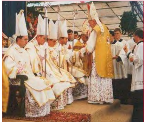
Les sacres à Ecône le 30 juin 1988

« Cette Eglise conciliaire est une Eglise schismatique parce qu'elle rompt avec l'Eglise catholique de toujours. Elle a ses nouveaux dogmes, son nouveau sacerdo-