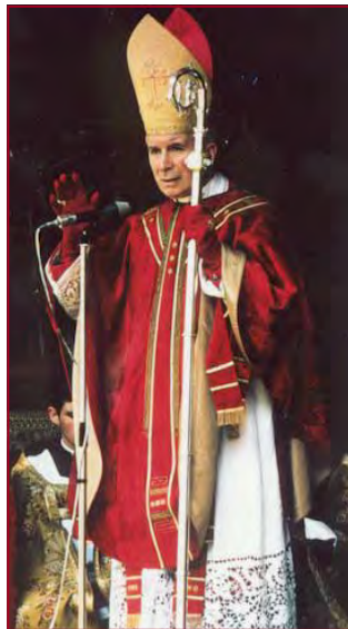
Monseigneur Lefebvre à Lille en 1976

Et c'est parce que l'on sait que ces prêtres seront fidèles à la messe de l'Eglise, à la messe de la Tradition, à la messe de toujours, qu'on nous presse de ne pas les ordonner. Je n'en veux pour preuve que ce fait: six fois depuis trois semaines, six fois on nous a demandé de rétablir des relations normales avec Rome et, comme témoignage, de recevoir le rite nouveau et de le célébrer moi-même. On est allé jusqu'à m'envoyer quelqu'un qui m'a offert de concélébrer avec moi dans le rite nouveau, afin de manifester que j'acceptais volontiers cette nouvelle liturgie, et qui m'a dit que, de ce fait, tout serait aplani entre nous et Rome. On m'a mis dans les mains un missel nouveau, en me disant: "Voilà la messe que vous devez célébrer et que vous célébrerez désormais dans toutes vos maisons." On m'a dit éga-