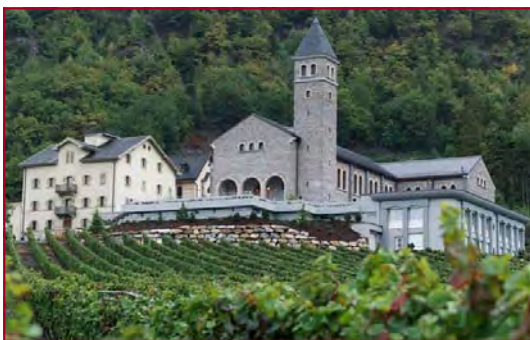
Ecône, le séminaire de l'espoir.