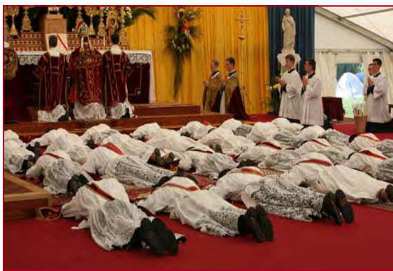
Ordinations des prêtres à Ecône

Il n'y a qu'une Église, dont nous sommes un rameau puissant, plein de sève, approuvé par l'Église absolument comme les autres Sociétés l'ont été autrefois et