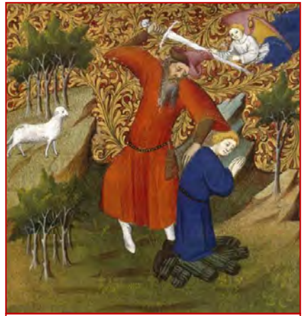
Abraham était prêt à sacrifier son fils pour obéir à Dieu

OUI puisqu'il est notre Créateur et notre Seigneur et que nous, nous sommes ses créatures faites pour le servir ici-bas et jouir de lui au Ciel. Avant de commettre le péché originel, Adam et Eve devaient déjà obéir à Dieu. Le péché originel qu'ils ont commis en mangeant du fruit de l'arbre de la Science du Bien et du Mal fut précisément un acte de désobéissance.