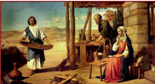
Pendant sa vie à Nazareth, Jésus obéissait à Marie et Joseph

OUI à l'exception de ce qui ne serait pas ou plus de leur ressort, ainsi que ce qui irait contre la foi ou les mœurs, car ils doivent nous conduire à Dieu.