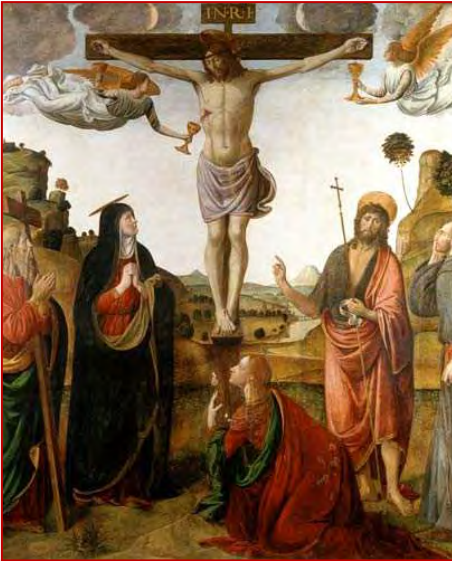
Obéissant jusqu'à la mort de la Croix

obéir à Dieu en toutes choses, sans jugement préalable, même si Dieu commande de sacrifier son fils (Abraham) ou d'épouser une femme adultère (Osée). Mais on ne peut obéir à l'homme que s'il est vraiment l'intermédiaire hiérarchique entre Dieu et nous-même, c'est-à-dire si son autorité est légitime et si elle ne dépasse pas les limites déterminées de sa propre juridiction. Cette double condition fait que l'on est toujours autorisé à juger. Si l'autorité du supérieur est légitime, si elle demeure dans les limites de sa juridiction, le sujet croyant est invité à ne plus voir en lui l'homme qu'il est, mais, si douloureux que soit son ordre, et d'autant plus s'il l'est, le Christ lui-même. Car alors, étant vraiment intermédiaire, le supérieur commande au nom de Dieu. Et la foi décuple la force et la joie de la soumission chez le sujet obéissant.