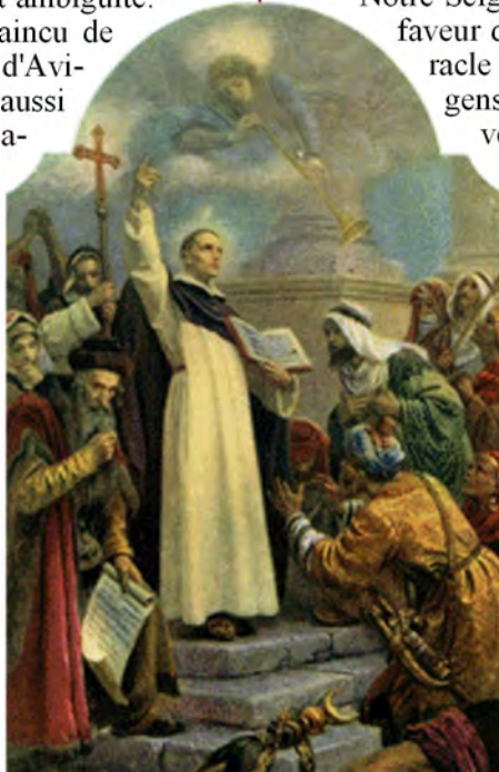
St Vincent Ferrer Fête le 5 avril

Après avoir de nouveau parcouru la France en prêchant, il partit à Vannes, où il allait mourir le 5 avril 1419. ♦