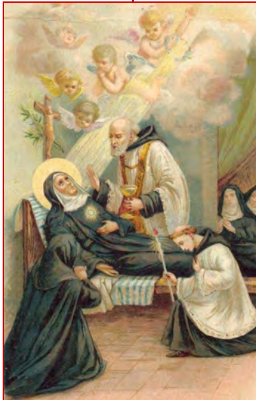
Sainte Julienne Falconieri Fête le 19 Juin