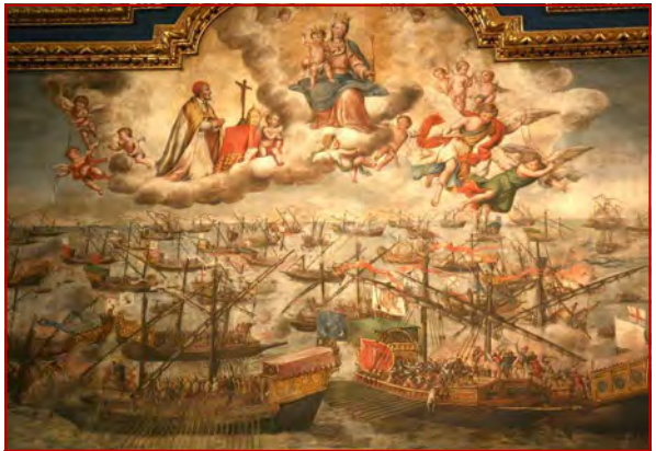
Bataille de Lépante : intervention de Notre Dame

Le musulman se leva avec une grimace, et retourna s'asseoir à sa place.