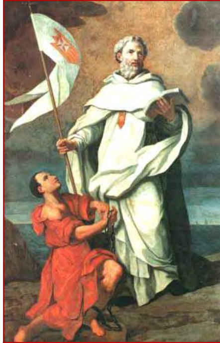
Saint Pierre Nolasque Fête le 28 janvier