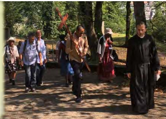
Chemin de croix à Lourdes

châsse de chêne recouverte d'argent, l'Arca Santa . Selon la tradition, ce suaire a été appliqué sur le visage de Jésus après sa crucifixion tandis que le saint-suaire de Turin, plus grand, est un linceul qui recouvrait tout le corps de Notre-Seigneur. Après la messe et une nuit à Lempdes et son crucifix miraculeux, direction Lourdes où nous terminons le pèlerinage du 23 au 25 août : piscines, procession aux flambeaux, visite et chapelet à la grotte, visite de la ville sur les pas de Bernadette, chemins de croix. Nous avons prié pour les chapelles et l'école en nous donnant rendez-vous en 2018 en Italie (Rome, Assise, San Giovanni Rotondo) pour les 50 ans de la mort de Padre Pio. Si Dieu veut !