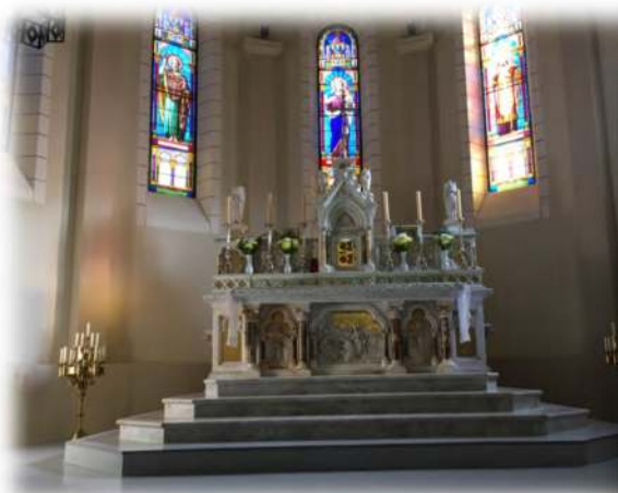
Autel de l'église des Petites Servantes de Saint Jean-Baptiste à Lourdes (« sœurs du Rafflay »)