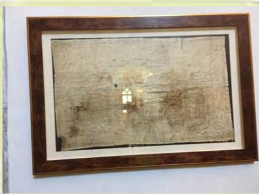
Saint suaire d'Oviedo (Espagne)