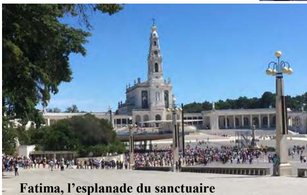
Fatima, l'esplanade du sanctuaire

le sanctuaire le Sanctuaire du bon Jésus du Mont ( Santuário do Bom Jesus do Monte ) ou Sanctuaire du bon Jésus de Braga . Le sanctuaire, de style baroque, possède une grande église, un escalier monumental qui compose la Voie Sacrée de Bon Jésus : tout au long du parcours ont été édifiées 17