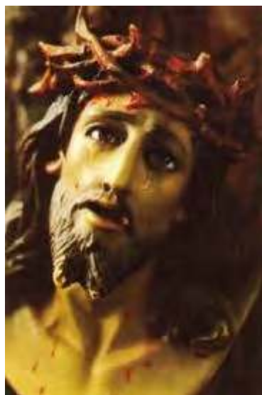
Christ de Limpias (Espagne)