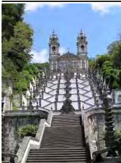
Escalier du Bon Jésus de Braga (Portugal)