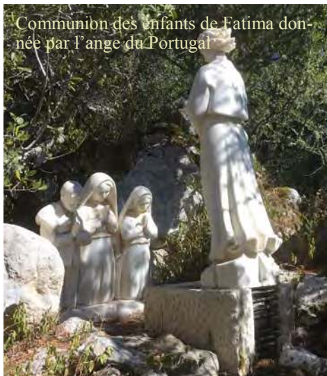
Communions des enfants de Fatima données par l'ange du Portugal

tions de la Vierge) donna la Sainte Communion aux trois pasteurs. L'après-midi, messe dans la jolie chapelle du prieuré de la Fraternité, rue de l'Immaculée Conception, à quelques minutes seulement du sanctuaire.