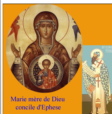
Marie mère de Dieu concile d'Ephèse

Aux ennemis de l'extérieur ont succédé les ennemis de l'intérieur appelés hérésiarques. D'où l'intervention de conciles évidemment sous l'autorité suprême du pape. Notre Seigneur Jésus-Christ s'est donc laissé bafouer de son vivant sur la terre de Palestine comme au ciel, après son ascension. Malheureusement la Très Sainte Vierge