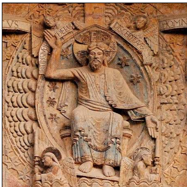
Le Christ en majesté, église Sainte Foy de Conques (12)

nés, éternellement condamnés au vide, et à l'ennui de sa présence, perdue pour toujours.