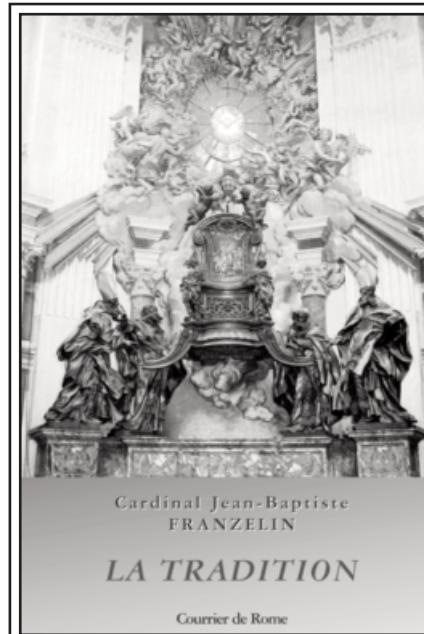
La chaire de saint Pierre au Vatican, par Le Bernin (1657-1666).