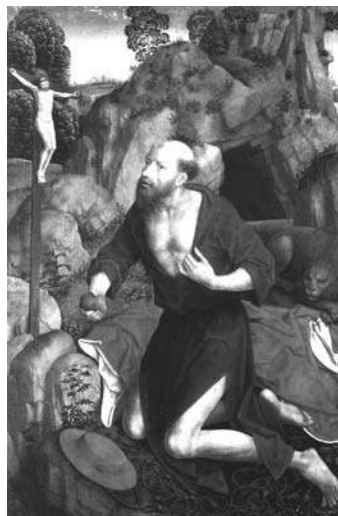
Saint Jérôme pénitent