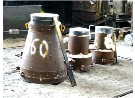
Le moule de la future cloche