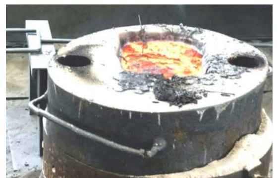
Ci-dessus : refroidissement de la cloche