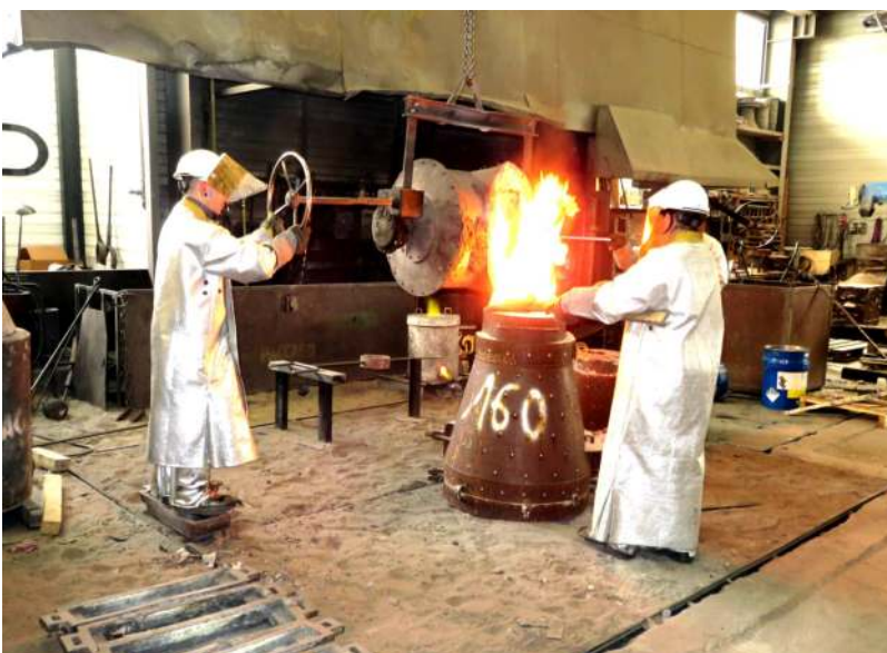
A gauche : les gaz échappés du moule sont enflammés