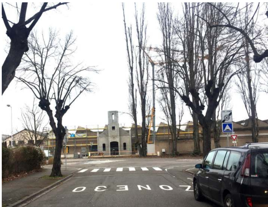
La perspective depuis la rue de la Soie, dégagée par l'abattage du mur de clôture