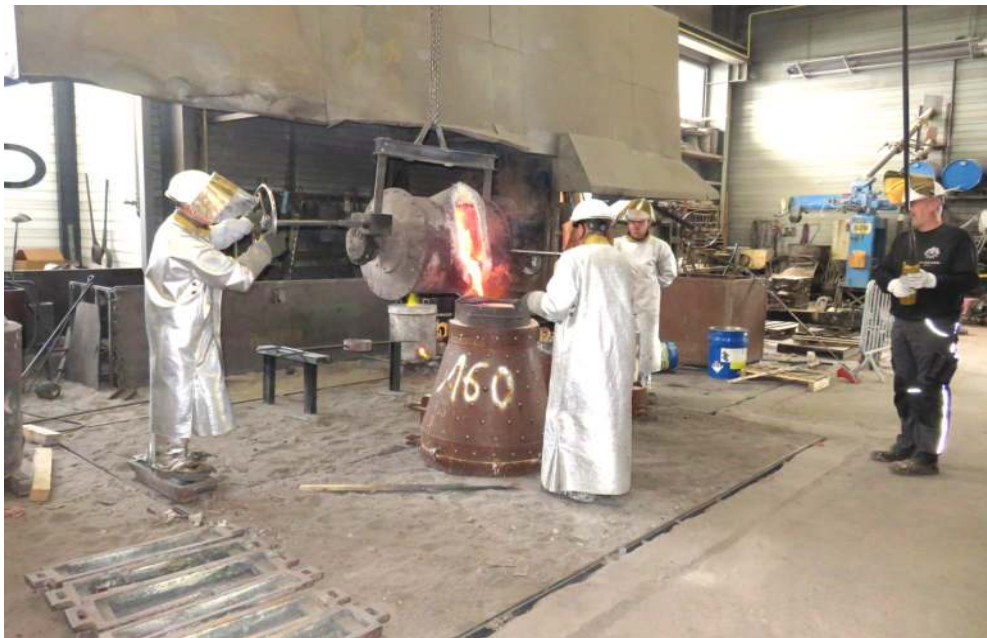
Le bronze est versé dans le moule