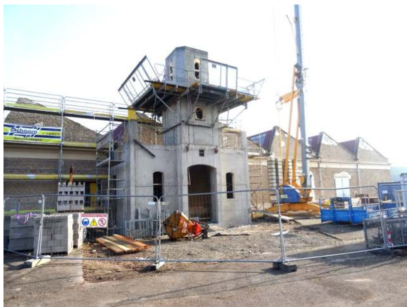
Construction de la chambre des cloches