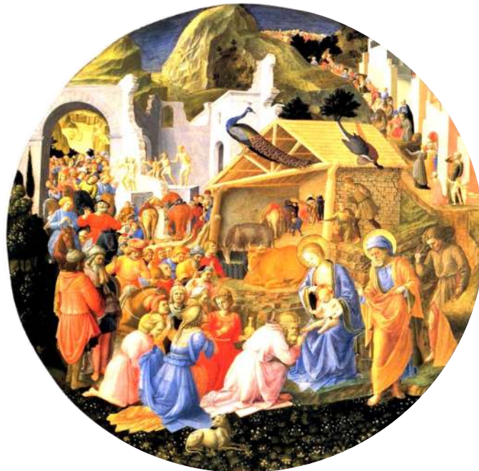
Filippo Lippi, Adoration des Mages

Alors, face à la vieillesse du monde appelé « nouveau » par les nouveaux socialistes en marche, face à la vieillesse de la théologie faussement nouvelle de Vatican II, face à la vieillesse de la « nouvelle » messe du siècle dernier, le dossier spirituel du pèlerinage nous invitera à proclamer et à montrer que NOUS SOMMES LA JEUNESSE DE DIEU.