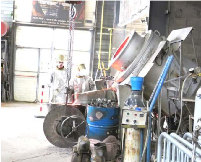
Le bronze en fusion est extrait du four