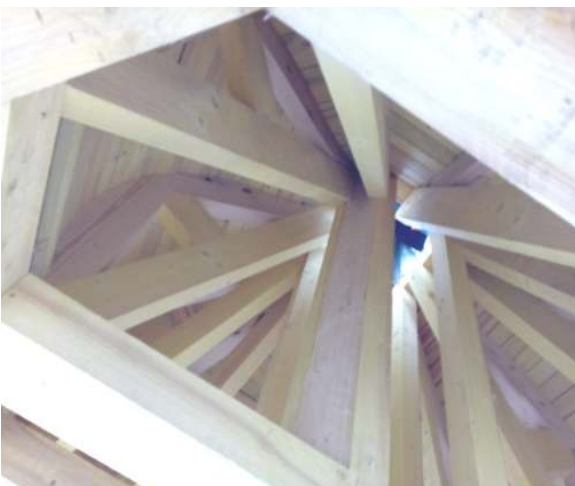
L'intérieur du bulbe