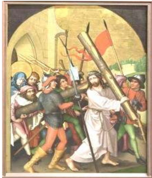
Portement de la Croix (Retable des Dominicains, Musée Unterlinden, Colmar)

Juste avant d'entrer dans le temps de la Passion, nous avons encore quelques jours pour profiter des enseignements et des dispositions que le Carême est censé donner. Ces enseignements se ramènent à la connaissance par la Foi de Notre-Seigneur Jésus-Christ et de la révélation par lui de la voie du salut éternel, et ces enseignements manifestent aux hommes la Bonté salvatrice du Verbe de Dieu, celle dont la connaissance nous mène à l'intelligence et à l'amour du mystère de la Croix.