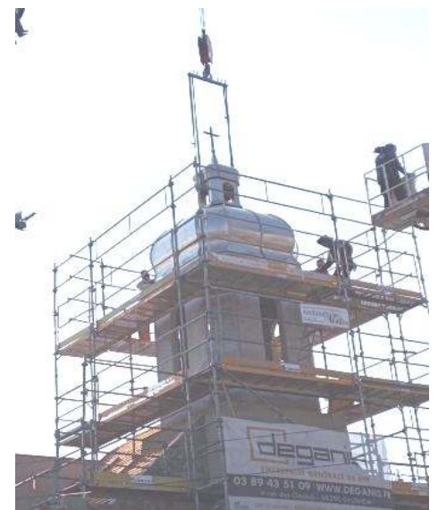
Mise en place du bulbe du clocher