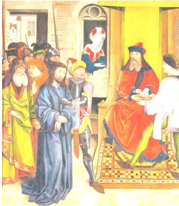
Jésus devant Pilate (Retable des Dominicains, Musée Unterlinden, Colmar)

Et pourtant combien de fois n'établis-je pas ce parallèle à son détriment ! Si même les plus grands