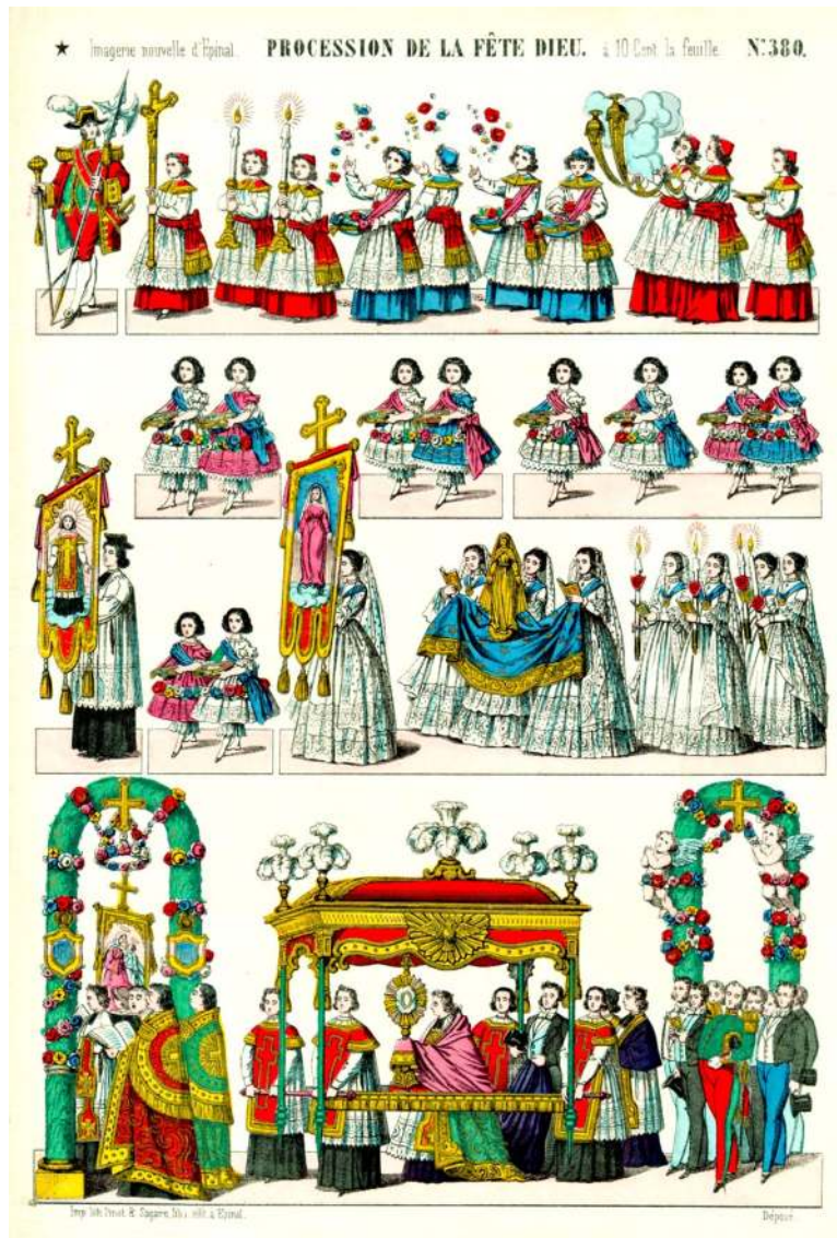
Procession de la Fête-Dieu, image d'Epinal

Un pont doit être traversé ; il est orné de bannières, de flammes aux couleurs ardentes ; chaque arbre semble porter un bouquet à sa ceinture... Enfin voici la barrière de fer du château, enlacée de lis naturels, et son avenue de sable. Les grains en sont moins nombreux que les feuilles de roses qu'une main pieuse y a répandues. Le pied du vieux donjon est décoré de tapisseries. La procession se répand dans le parc ; elle revient en serpentant sur elle-