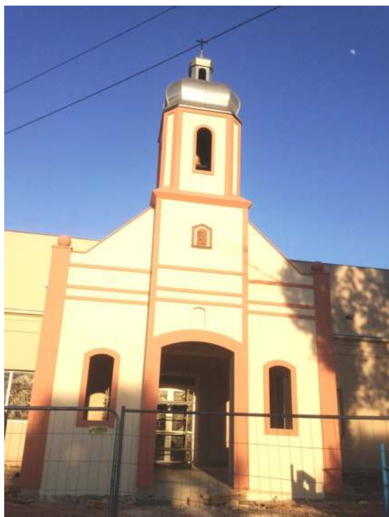
Les échafaudages ont enfin disparu !