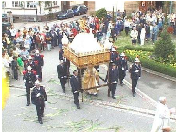
Fête-Dieu à Geispolsheim

« Et voici que je serai avec vous tous les jours, jusqu'à la consommation des siècles ». Le Christ après son Ascension dirige et assiste son Église, mais il est particulièrement présent, bien qu'invisible, dans le Sacrement de l'Eucharistie.