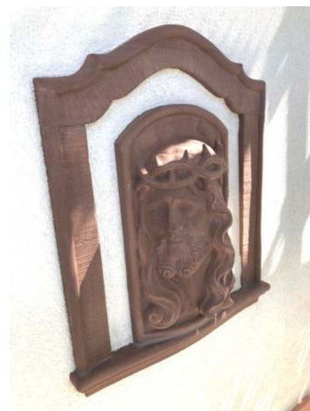
Bas-relief du fronton, sculpté par M. Ledermann