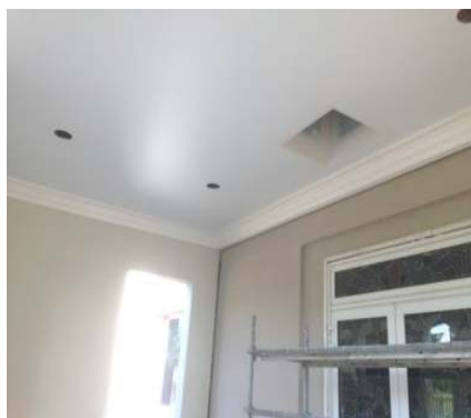
Pose du plafond du rez-de-chaussée

Renseignements : edm75ans@protonmail.com