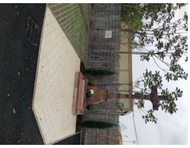
La mise en valeur du Cadvaire

Un grand merci à tous ceux qui, par leur travail et/ou par leurs dons, ont permis l'embellissement extérieur de notre chapelle