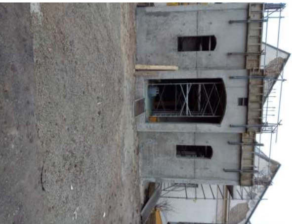
La base de la tour