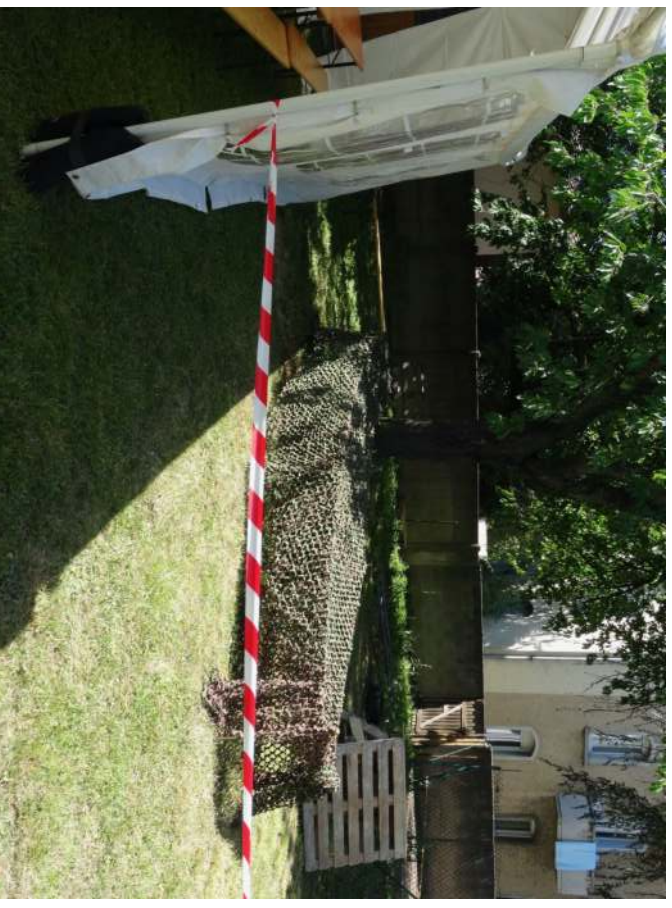
Kermesse du prieuré : le parcours du combattant

Une joie : la kermesse a vu nettement augmenter la participation de bénévoles pour tenir des stands. On a pu remarquer un stand nouveau dédié à la peinture et à la calligraphie, agréablement décoré, ainsi qu'un stand déjà existant mais réaménagé avec goût, la brocante, et surtout les stands de jeux qui tous ont bien fonctionné. Cette amélioration notable nous incite à continuer à progresser l'an prochain, et à souhaiter que cet événement réunisse encore plus de paroissiens de nos trois chapelles.