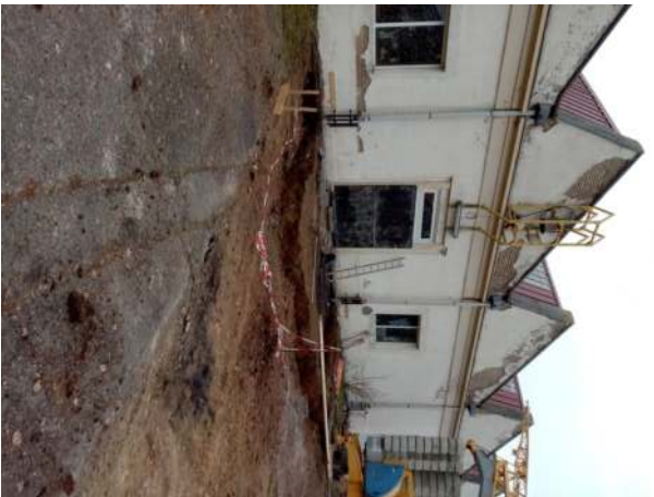
Les fondations de la tour