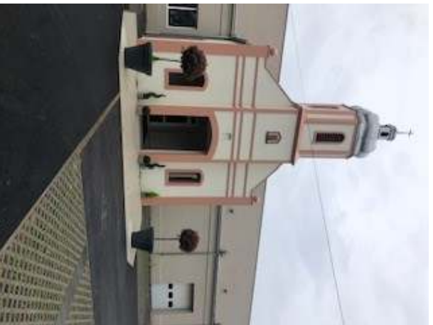
Le revêtement de la cour