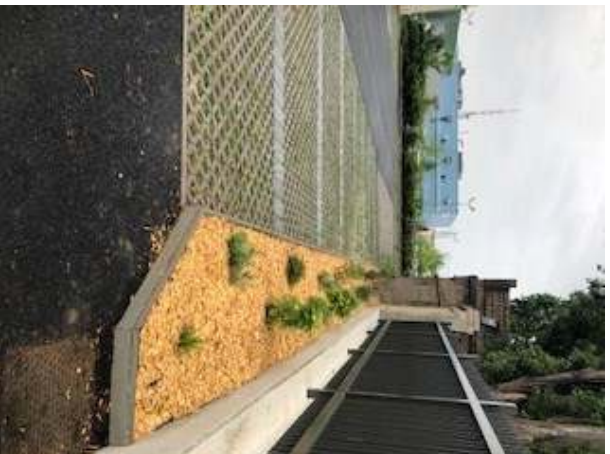
Le stationnement dans la cour