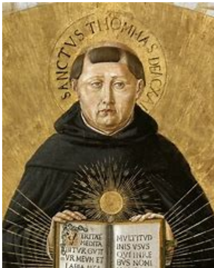
Le triomphe de saint Thomas d'Aquin (Louvre)

Au terme de ses études, il est envoyé par ses supérieurs à Paris pour y enseigner. Devenu maître en théologie en 1256, il poursuit son enseignement parisien comme Maître-Régent jusqu'en 1259. Sa hiérar-