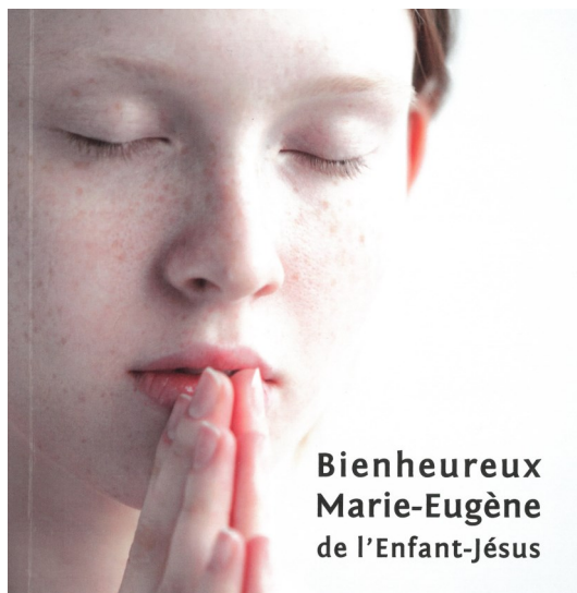
Bienheureux Marie-Eugène de l'Enfant-Jésus

« Lorsque la distraction n'est plus seulement passagère pendant l'oraison, mais que, par suite de l'impuissance de l'intelligence à se fixer sur un sujet quelconque et de sa mobilité, elle devient un état quasi habituel, elle constitue un état de sécheresse. La sécheresse s'accompagne ordinairement de tristesse, d'impuissance, de diminution des ardeurs de l'âme, d'agitation et d'énervement des facultés. »