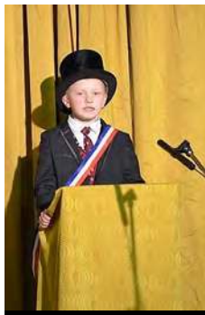
M. le Maire