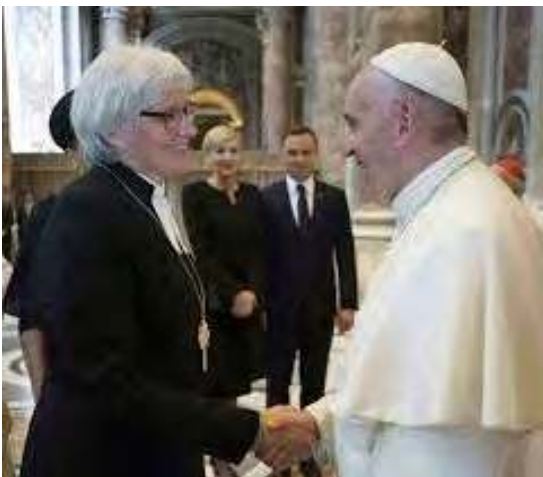
Le Pape François rencontre une « évêque » luthérienne en Suède