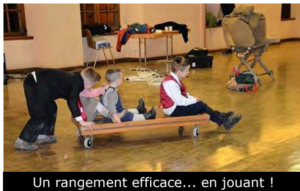
Un rangement efficace... en jouant !