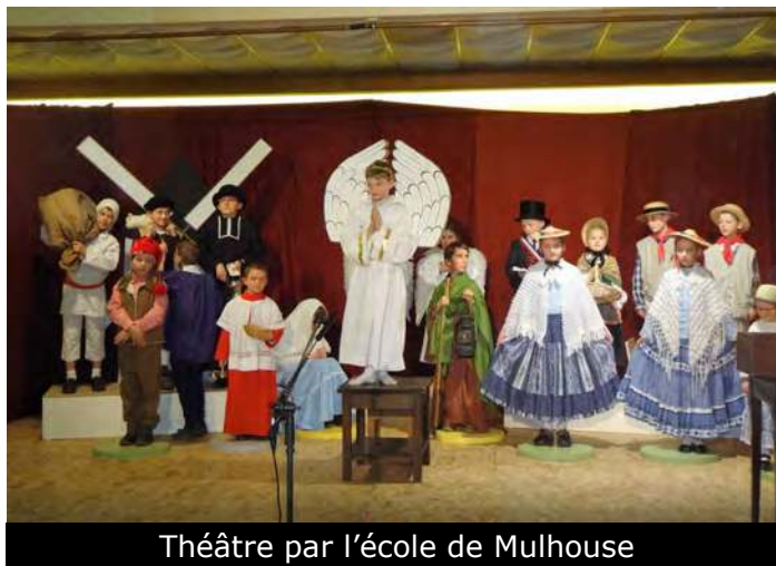
Théâtre par l'école de Mulhouse