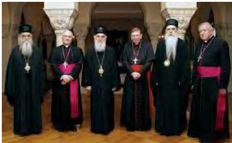
Le Cardinal Koch en compagnie d'Orthodoxes

Russes, notamment parce que ces derniers reprochent à l'Eglise catholique de soutenir les communautés unies à Rome vivant dans leurs pays, les fameux Uniates... Un document de 2007, commun entre catholiques et orthodoxes, a permis, paraît-il, de mettre en valeur la nature « synodale » de l'Eglise. Autrement dit, on a fait plaisir aux schismatiques en leur accordant que les assemblées d'évêques sont importantes dans l'Eglise, sans leur faire lâcher la moindre concession sur le primat de l'évêque de Rome, question qui « reste au centre du dialogue œcuménique ». Le dernier « concile panorthodoxe », l'été dernier, a du reste montré que, sur la question œcuménique, « des tendances très différentes sont apparues dans l'orthodoxie ». En clair, la situation ne se simplifie pas avec le temps, et aucune Eglise orientale ne paraît disposée à faire des concessions.