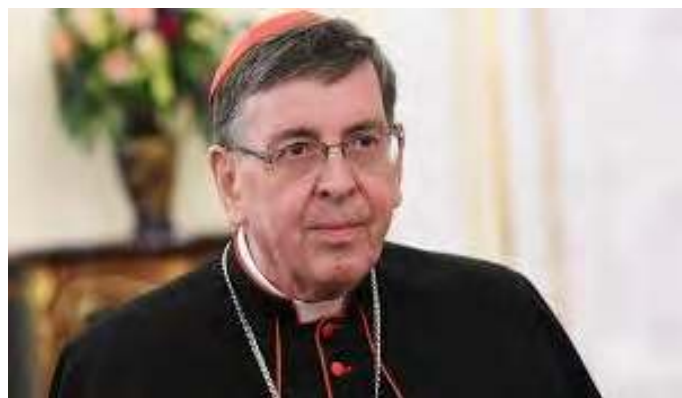
Le Cardinal Kurt Koch

Tout d'abord, le Cardinal admet qu'il subsiste une incertitude de principe : tous s'accordent – plus ou moins – à reconnaître qu'il faut faire l'unité de l'Eglise... mais qu'est-ce que l'Eglise ? « Il y a fondamentalement autant de conceptions du but œcuménique que d'ecclésiologies confessionnelles. Cela signifie que le manque d'accord sur le but du mouvement œcuménique résulte de manière non négligeable d'un manque d'accord œcuménique sur la nature de l'Eglise et de son unité. » Pour un catholique, l'unité de l'Eglise repose sur une même foi, des sacrements identiques, et un gouvernement commun. Pour un protestant, il suffit de reconnaître l'Évangile comme règle unique de foi. Pour un orthodoxe, il faut l'autorité d'un évêque... Bien sûr, des commissions travaillent, des documents sont élaborés mais même le dernier en date, issu du Conseil œcuménique des Eglises, « ne parvient pas à faire avancer l'entente théologique concernant la majeure partie des thèmes ecclésiologiques controversés au-delà de la formulation des questions toujours en suspens... Les diverses Eglises risquent d'avancer dans des directions différentes et de se rendre compte ensuite qu'elles se sont encore plus éloignées qu'elles ne l'étaient auparavant. »