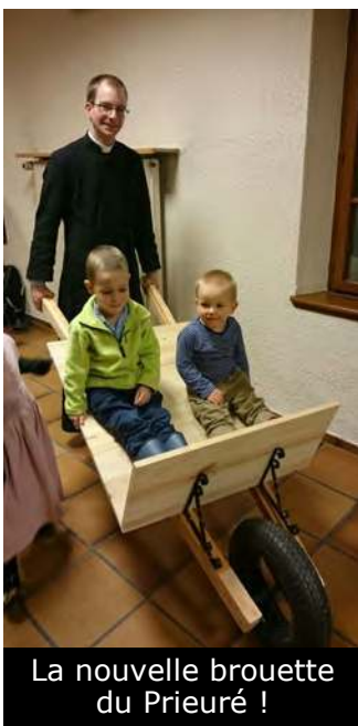
La nouvelle brouette du Prieuré !