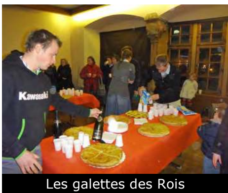
Les galettes des Rois