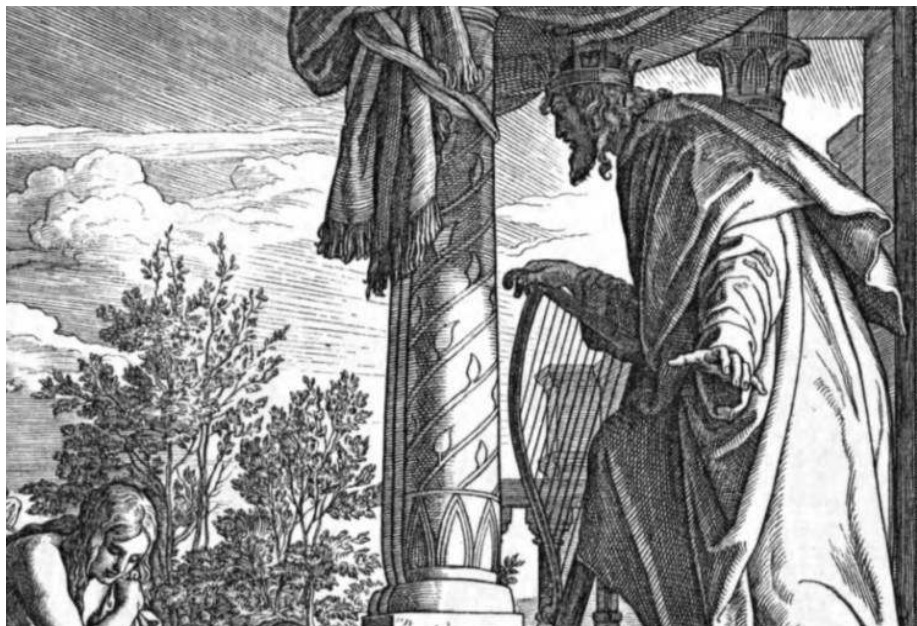
David et Bethsabée (Bible de Schnorr)

pensée de l'essentiel. Au milieu de la masse d'informations qui nous submerge chaque jour, combien d'éléments réellement utiles ? Certes, la curiosité peut être légitime, mais à condition de porter sur un objet utile et bon, qui enrichisse notre culture, notre réflexion ou notre foi. Or la plupart des médias actuels recherchent plutôt le sensationnel, l'étrange, l'insolite, et ils ne trouvent bien souvent que du scabreux. Est-il normal que nous trouvions toujours du temps pour nous informer du dernier « buzz » que nous aurons oublié dans quelques jours, et jamais pour lire la Sainte Ecriture, pourtant bien plus actuelle ? N'est-il pas regrettable que nous connaissions mieux la vie des vedettes en vogue que celle des saints ? Est-il raisonnable que nous soyons très au fait des dernières rumeurs de la « tradisphère » alors que nous négligeons de nous former sérieusement sur la crise de l'Eglise ?