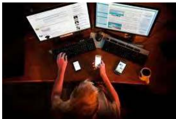
Dépendance à l'image... ?

Et comme toujours en pareil cas, ces moyens naturels n'auront d'efficacité que s'ils s'appuient sur la prière et les