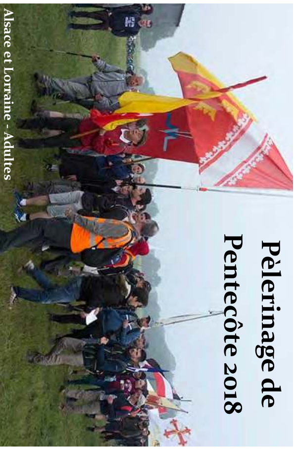
Alsace et Lorraine - Adultes

tracts d'inscription à la messe du prieuré, 17 juin 2018