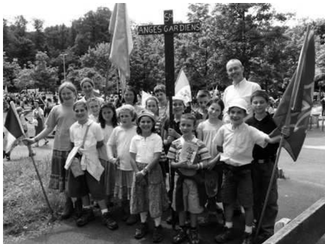
Le chapitre des Saints Anges Gardiens Ils ont prié pour leurs bienfaiteurs

RÉPONSE : La tristesse qui vous afflige aujourd'hui vient du fait que vous oubliez l'importance de la notion de devoir dans la vie chrétienne. Quand un mari s'oblige à écouter sa femme ou jouer avec les enfants alors qu'il aurait bien envie de faire autre chose, sa conduite est bel et bien une conduite d'amour. Notre-Seigneur ne nous dit pas d'aimer lorsque nous en aurions spontanément le désir ; il nous en fait une obligation : 'Tu aimeras!' Par conséquent lorsque vous avez l'impression de déployer une énergie considérable pour accomplir vos exercices de piété, ne vous faites pas de souci. Votre démarche est bien une démarche d'amour. Vous plaisez peut être mieux à Notre-Seigneur en vous livrant péniblement à cet exercice que si vous l'accomplissiez avec enthousiasme, dans la mesure où vous ne cherchez qu'à lui obéir, alors que vous ne recevez en échange aucune consolation sensible.