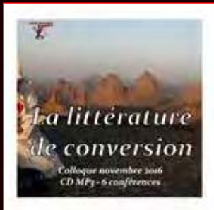
CD audio MP3 15€

L'Institut Universitaire Saint-Pie X est un établissement d'enseignement supérieur sous Jury rectoral qui prépare aux licenciés et aux diplômés de Philosophie, d'Histoire et d'Humanités et dont les diplômés sont reconnus par l'État (excepté en philosophie). Il assure en outre une formation des maîtres pour les futurs enseignants des écoles primaires et secondaires. Il est habilité à accueillir les étudiants boursiers de l'État en histoire et en humanités