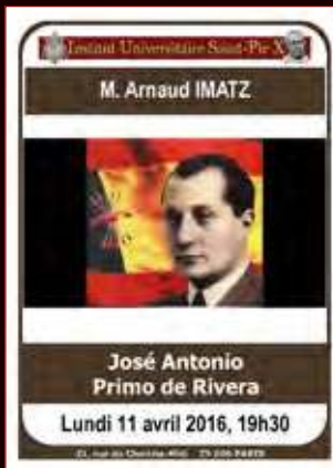
CD audio 10€