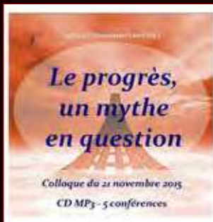
CD audio MP3 15€