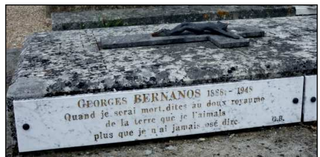
Cimetière de Pellevoisin