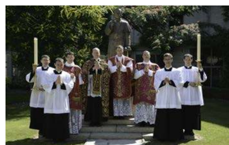
Première Messe à Ecône le 30 juin.