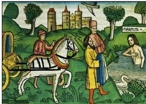
La purification de Naaman

Dans la Bible, au cinquième chapitre du second livre des Rois, l'auteur sacré nous raconte la très touchante histoire de ce chef de l'armée du roi de Syrie. L'écriture nous révèle ses qualités. Naaman, c'est son nom, était «un homme puissant et considéré ... mais cet homme fort et vaillant était lépreux.» Naaman apprenant qu'en Israël se trouvait un prophète capable de le délivrer de sa lèpre, vint se présenter devant Elisée. Ce dernier ne se déplaça aucunement. Le prophète lui envoya tout simplement un messenger pour lui dire : «Va, et lave-toi sept fois dans le Jourdain; ta chair te reviendra, et tu seras pur.» Naaman irrité, comme savent l'être les hommes de guerre, s'en alla disant: «Voici que je me disais : Il sortira vers moi, il se présentera lui-même, il invoquera le nom de