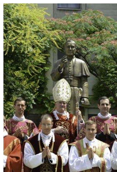
Sacerdos in aeternum.