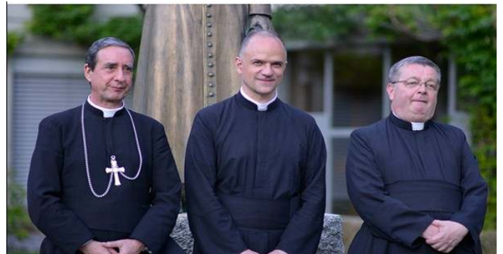
Le nouveau Supérieur général et ses deux assistants