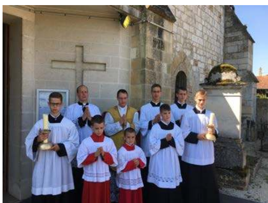
Première Messe à Annelles le 7 juillet.