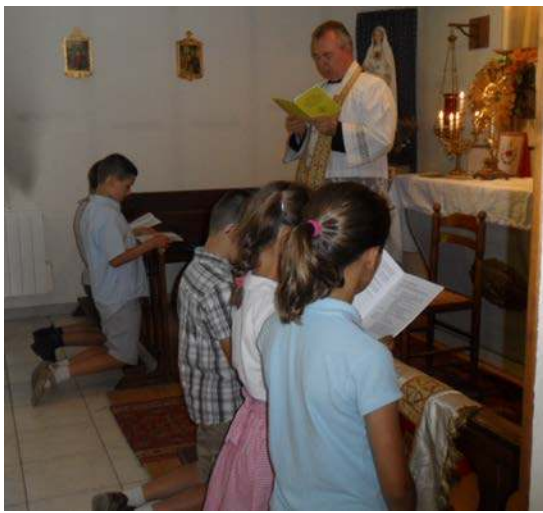
Mardi 26 juin : Cérémonie d'engagements dans la Croisade Eucharistique.