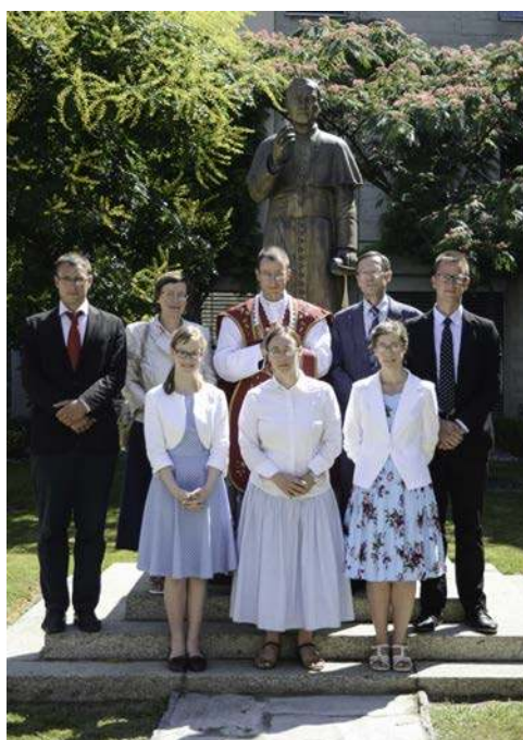
La famille Tassot bénite par Saint Pie X.