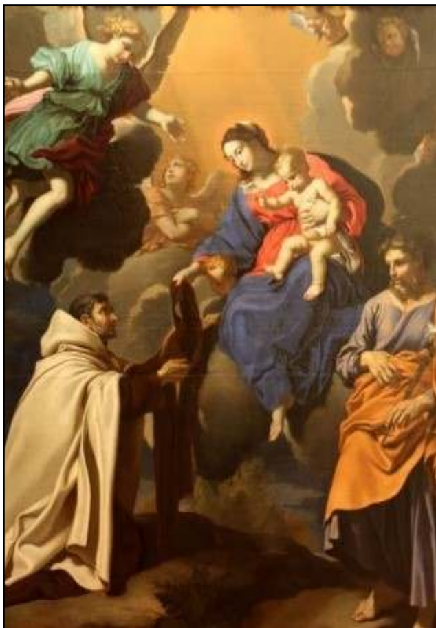
Saint Simon Stock reçoit le scapulaire des mains de Notre-Dame