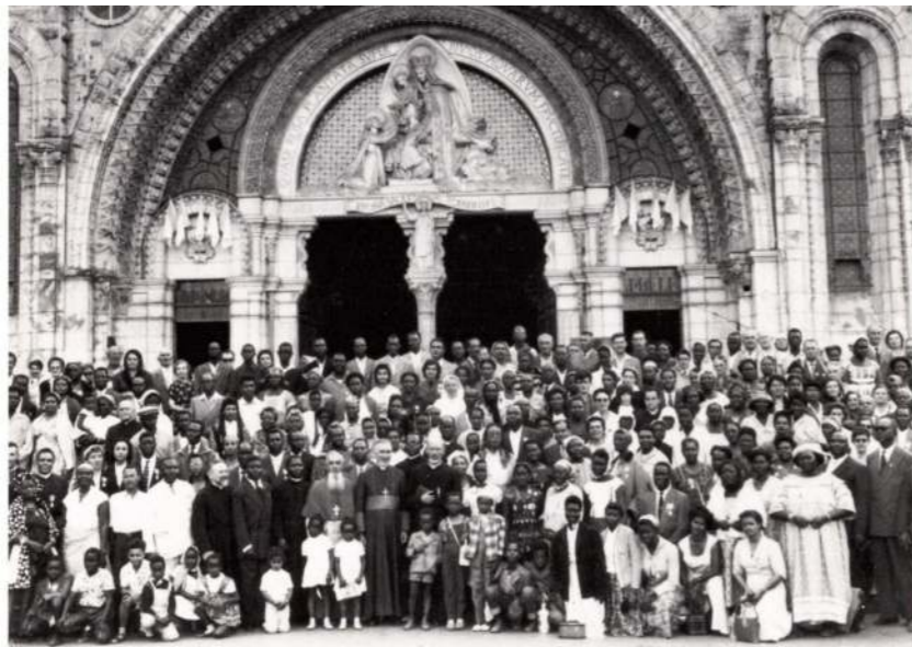
Pèlerinage du Diocèse de Dakar - Lourdes août 1978 Centenaire

En effet, l'Evangile dit de la Vierge Marie, qu'elle entendait toutes ces paroles et qu'elle les repassait dans son cœur. Elle devait donc réfléchir - elle remplie de l'Esprit Saint, remplie de l'Esprit de sagesse, de science, d'intelligence - elle devait réfléchir sur tout ce qu'elle avait entendu. Rappelons-nous avec elle toutes ces paroles : paroles de l'ange Gabriel : vous êtes bénie