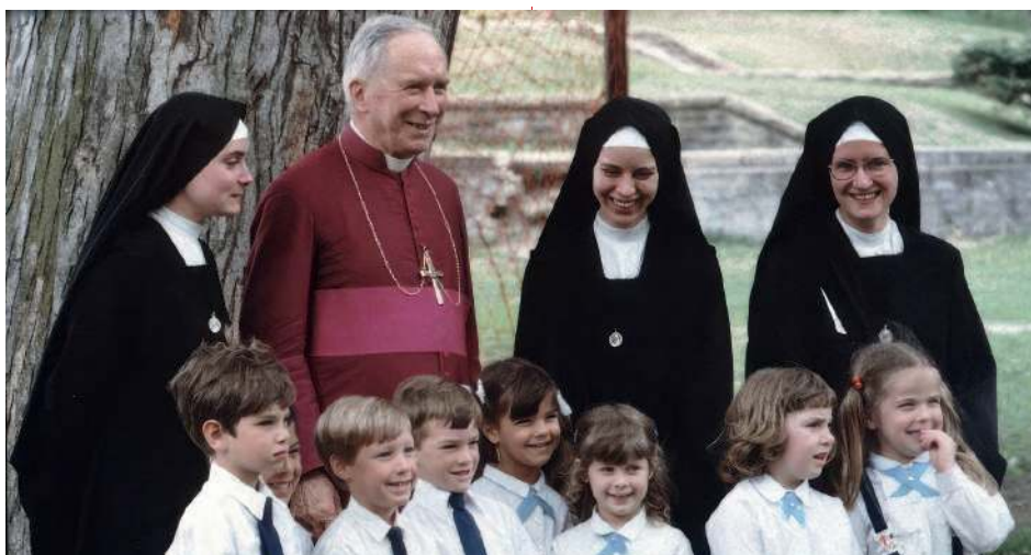
Monseigneur Lefebvre et les Sœurs de la Fraternité Saint-Pie X

Enfin, toujours dans les Constitutions de la congrégation des Sœurs de la Fraternité Saint-Pie X, il est écrit :