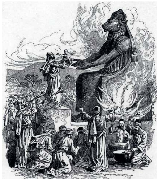
Offrande à Moloch, faux dieu des Cananéens connu pour les sacrifices d'enfants qu'on lui offrait (Charles Foster, 1897)

créées par les hommes. Cependant dans ces révolutions destructrices de l'ordre et des autorités légitimes, qui étaient comme des révoltes plus ou moins explicites contre la loi de Dieu, le sang versé n'était pas à la base du mouvement révolutionnaire. Il en était plutôt une conséquence indispensable, afin que ce mouvement réussisse.