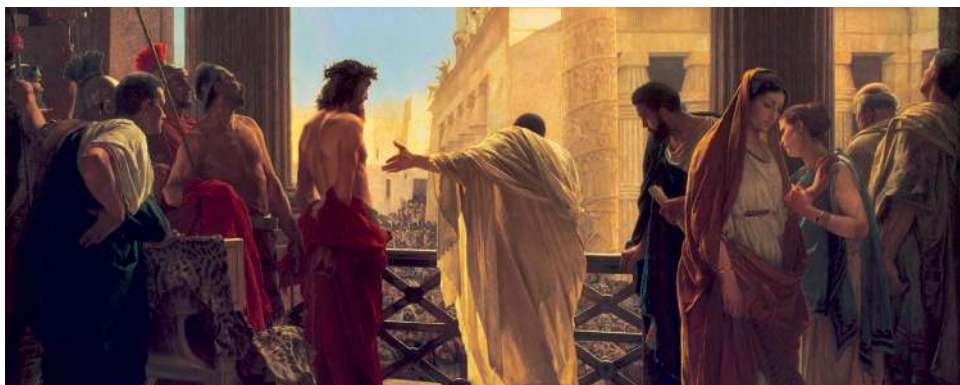
« Ecce Homo » Ponce Pilate présentant Jésus à la foule - Antonio Ciseri (1821-1891)

qui agissent après l'école sur ces pseudo-adultes. [...] Saint Jean a reçu de Dieu de nommer Bestia , la Bête, la monstrueuse puissance implacablement, féroce, acharnée à réduire l'homme à la bestialité, afin qu'il se retrouve heureux de son sort lorsque, sans fierté, sans liberté, sans pensée même, ses maîtres lui auront fourni à satiété panem et circenses , de la victuaille et les jeux obscènes du cirque. »