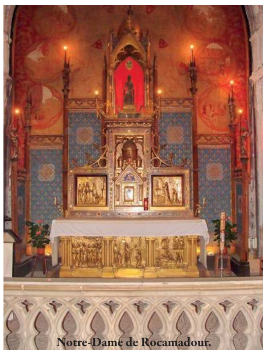
Notre-Dame de Rocamadour.

08 mars : le Prieur rend visite à la communauté paroissiale de Périgueux.