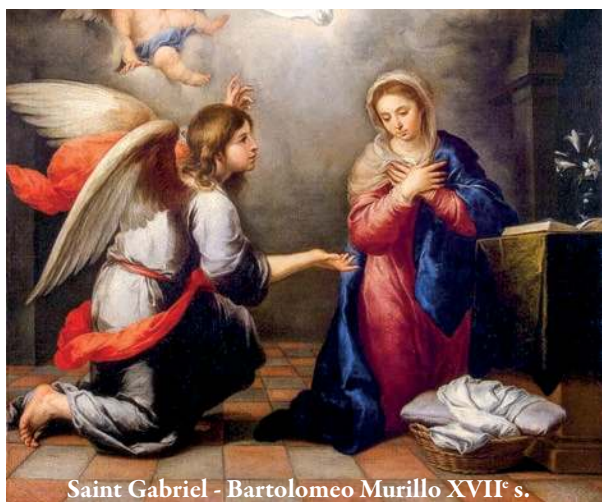
Saint Gabriel - Bartolomeo Murillo XVII e s.

« A la fin, mon Cœur Immaculé triomphera. » (Notre-Dame de Fatima)