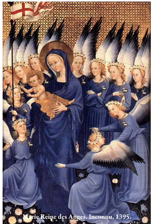
Marie Reine des Anges. Inconnu. 1395.

Alors, avec les neuf Chœurs des anges, entonnons un vibrant Salve Regina en l'honneur de la Reine des anges et des hommes. ■