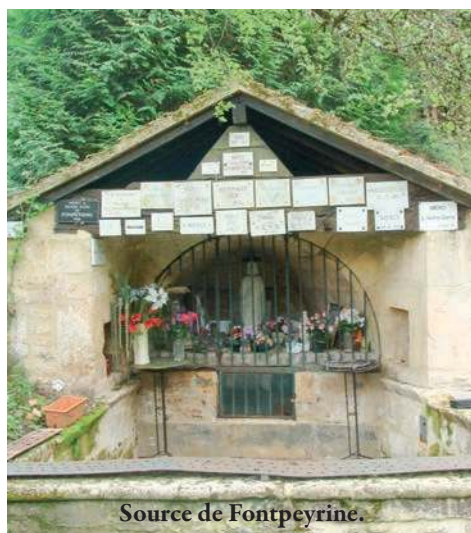
Source de Fontpeyrine.