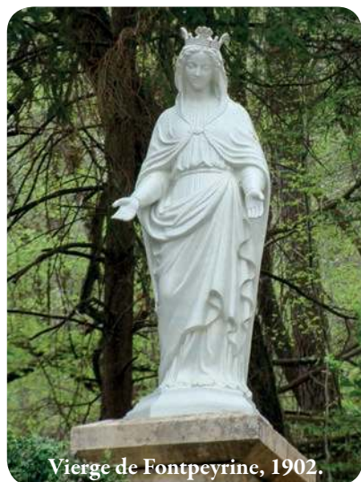
Vierge de Fontpeyrine, 1902.