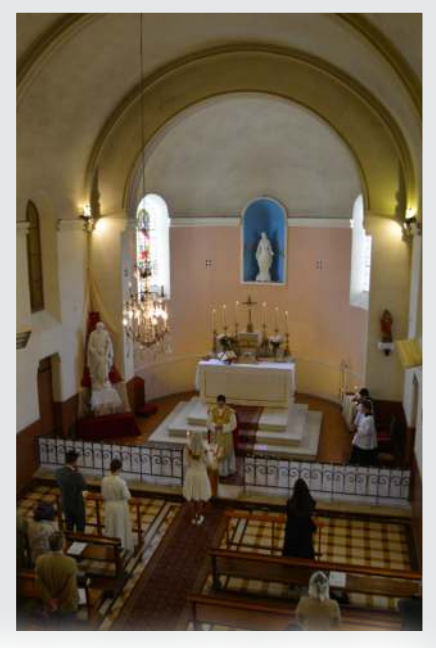
28 mai - COMMUNIONS SOLENNELLES