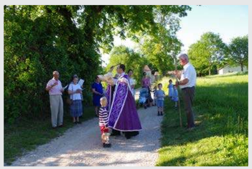
22-23-24 mai - ROGATIONS