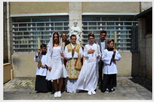
28 mai - COMMUNIONS SOLENNELLES