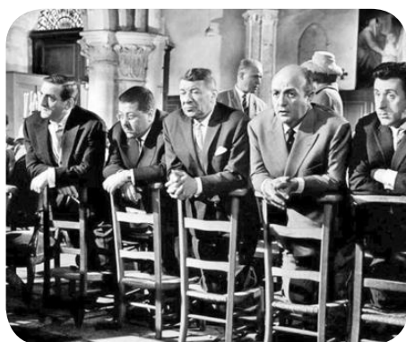
Quand l'habitude devient machinale...

Prieuré Sainte-Jeanne-d'Arc 2, rue de Clairat - 24100 Bergerac Tél.: 05 53 22 56 89 Fax: 09 81 38 17 02 Courriel: 24p.bergerac@fsspx.fr www.laportelatine.org