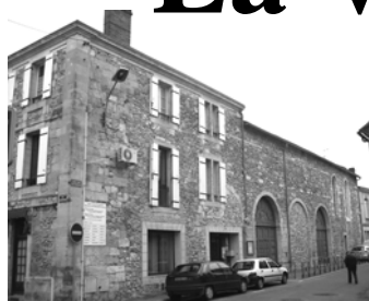
Eglise SAINT JEAN L'EVANGELISTE