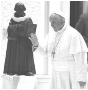
Le pape reçoit Luther

A la lecture de la déclaration conjointe que le pape a faite avec les représentants de l'église luthérienne en Suède le 31 octobre, à l'occasion du cinquième centenaire de la révolte de Luther contre l'Église catholique, notre douleur est à son comble .