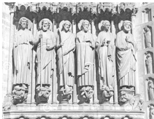
Six apôtres : Cathédrale Notre-Dame de Paris

Rendons honneur à ces apôtres, dont l'intercession est bien nécessaire aujourd'hui pour que les hommes d'Église reviennent à la foi des apôtres. Solennisons la fête de ces amis du Seigneur, princes et colonnes de l'Église éternelle.