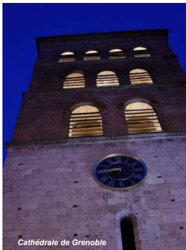
Cathédrale de Grenoble

des raisons économiques dont rien n'atteste la pertinence, reviendrait à dégrader l'ensemble de la vie sociale : ouverture des magasins,