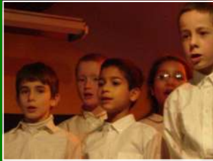
21.12 : Concert de Noël

24-25.11 : Marché de Noël (MEY) ; 7.000 € pour l'Ecole 27.11 : Catéchisme pour Adultes (MEY) ; 4e cours ( Pourquoi cette querelle sur la liberté religieuse ? ) Du 27 au 30.11 : l'Abbé Lambilliotte (arrivé en octobre, qui remplace l'Abbé Grave, parti pour Nice) est au Pointet pour une session d'étude 01.12 : Récollections de l'Avent à Meylan (Abbé Vassal) et Annecy (Abbé Lambilliotte) 02.12 : Topo de l'Abbé Beaublat à Lyon, pour le MJCF Rhône-Alpes. Thème : le Motu Proprio 04.12 : Catéchisme pour Adultes (NDM) ; cf. 27.11 05.12 : Sortie de communauté (Chamrousse) 08.12 : Récollections de l'Avent à La Ravoire (Abbé Lambilliotte) et ND des Millières (Abbé Beaublat) 09.12 : Catéchisme pour Adultes (ANN) 11.12 : Catéchisme pour Adultes (MEY) ; 5e cours ( Qu'entend-on par Royauté sociale du Christ ? ) 13.12 : Réunion des Ménages (ANN) 15.12 : Réunion des Compagnons de Saint-Joseph (MEY) 17.12 : Les CE et CM de l'Ecole visitent le Musée Dauphinois 18.12 : Catéchisme pour Adultes (NDM) ; cf. 11.12 21.12 : Concert de Noël de l'Ecole Du 26 au 30.12 : Camp HP des Guides de St-Nicolas et de Fanjeaux, avec l'Abbé Pierre-Yves Chrissème Du 07 au 12.01 : L'Abbé Lambilliotte prêche une retraite au Pointet 08.01 : Padre Samuel Bon nous présente un diaporama sur son apostolat en Argentine (MEY) 10.01 : L'Abbé Beaublat est à Paris pour la réunion annuelle des directeurs d'écoles primaires