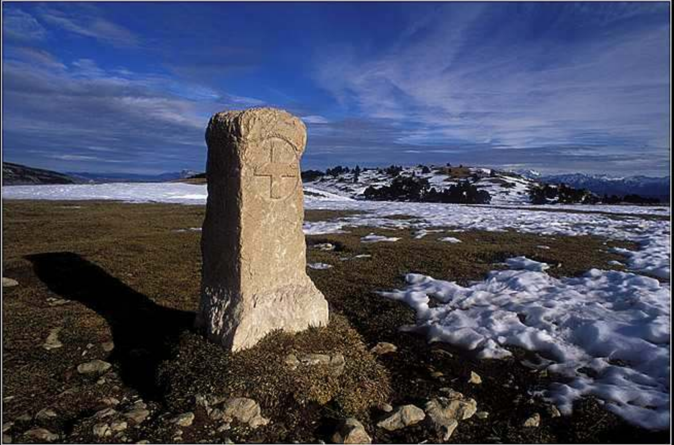
Borne frontière entre le Dauphiné et la Savoie, Col de l'Alpe

«Le grand mal des temps, c'est qu'on ne va pas à Jésus-Christ... et surtout à Jésus dans l'Eucharistie.» Saint Pierre-Julien Eymard BULLETIN DU PRIEURÉ SAINT PIERRE-JULIEN EYMARD N°1 (59)