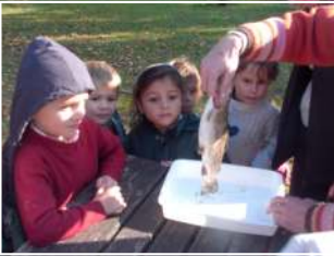
08.11 : Leçon de choses à l'Ecole