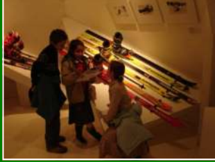
17.12 : Exposition sur le Ski