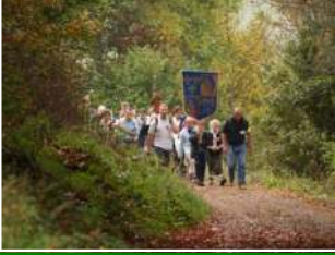
06-07.10 : Pèlerinage de La Salette