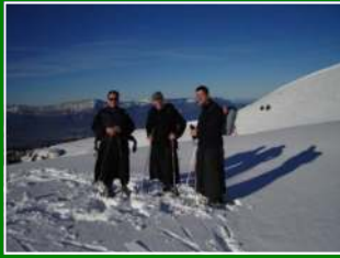
05.12 : Raquettes aux pieds