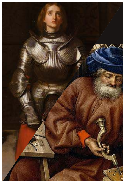
Sainte Jeanne d'Arc et saint Joseph deux âmes magnanimes