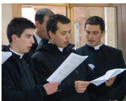
Séminaristes de Flavigny

Si nous aimons l'Eglise, si nous avons à cœur de procurer aux âmes le bonheur éternel, nous ne pouvons que souhaiter de nombreuses vocations et de saints prêtres. Si le choix de Dieu est mystérieux et parfois extraordinaire, il existe néanmoins un terrain propice à l'éclosion d'une vocation. Le « premier jardin et le mieux adapté, dit le pape Pie XI, c'est encore toujours la famille vraiment et profondément chrétienne. Les exceptions à cette règle sont rares et ne font que confirmer la règle. »