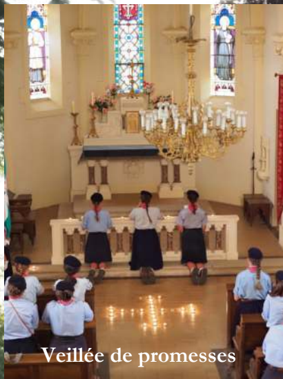
Veillée de promesses