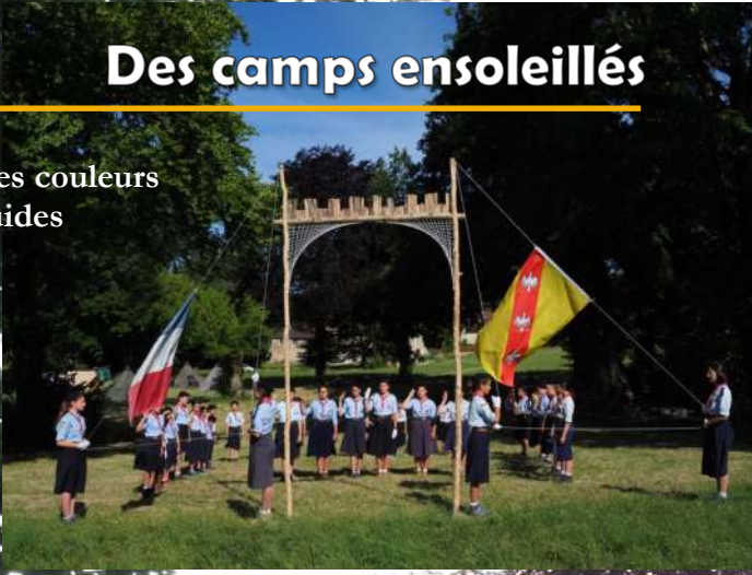
Mât des couleurs des guides

Résumé en images des camps du mois de juillet à Vadelaincourt (Meuse)