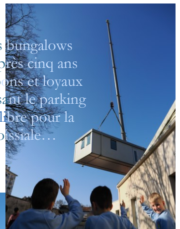
Départ des bungalows de l'école après cinq ans et demi de bons et loyaux services, laissant le parking à nouveau libre pour la vie paroissiale...