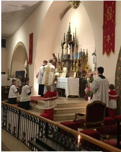
Baptême de Florian Bessueille à Ars-sur-Moselle la nuit de Noël. →