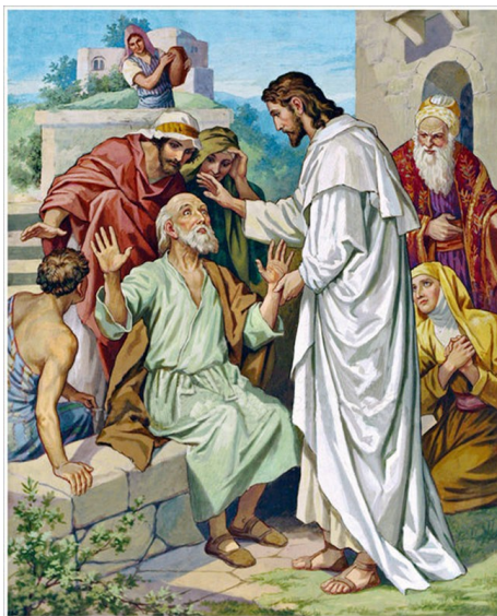
Guérison d'un sourd-muet

Dans l'Eglise primitive, on nommait le troisième dimanche de Carême le Dimanche des scrutins, parce que c'était en ce jour que l'on commençait l'examen des Catéchumènes qui devaient être admis au Baptême dans la nuit de Pâques. Tous les fidèles étaient invités à se présenter à l'église pour rendre témoignage de la vie et des mœurs de ces aspirants à la milice chrétienne. A Rome, ces examens, auxquels on donnait le nom de Scrutins, avaient lieu en sept séances, à raison du grand nombre des aspirants au Baptême ; mais le principal Scrutin était celui du Mercredi de la quatrième semaine.