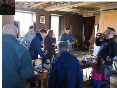
Camp d'hiver du Groupe M gr Ginisty à St-André-en-Barrois