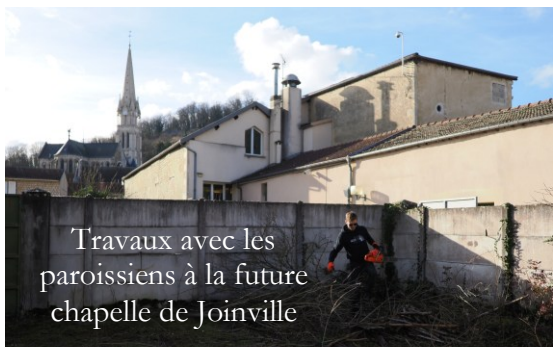
Travaux avec les paroissiens à la future chapelle de Joinville