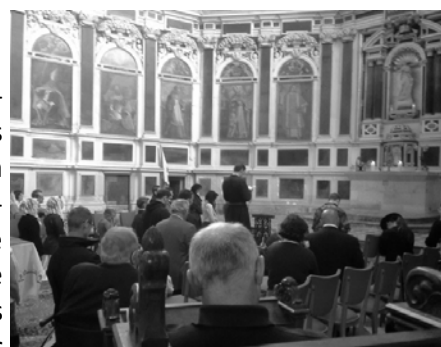
Vénération de la relique du saint Clou dans le chœur de la cathédrale.