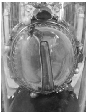
Détail du reliquaire

Ce fut une cérémonie émouvante, et l'occasion de raviver en nos cœurs le souvenir de la Passion. Que le Seigneur soit vivement remercié pour toutes les grâces qu'il nous a accordées durant ce saint pèlerinage.