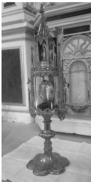
Le Saint Clou en son reliquaire

La Providence a voulu que la chrétienté puisse conserver des reliques de la Passion, témoins visibles de ce que Dieu a souffert pour nous. Or la Cathédrale de Toul a l'honneur insigne d'être dépositaire de l'une de ces plus insignes reliques : le saint Clou de la Passion de Notre-Seigneur. Cette relique a une histoire qu'il faudra vous conter plus au long dans un autre numéro. Bornons-nous pour le moment à préciser qu'il s'agit de la pointe du clou conservé à Trèves, pointe de près de cinq centimètres de longueur. Quel souvenir saisissant des indicibles souffrances de notre Rédempteur !