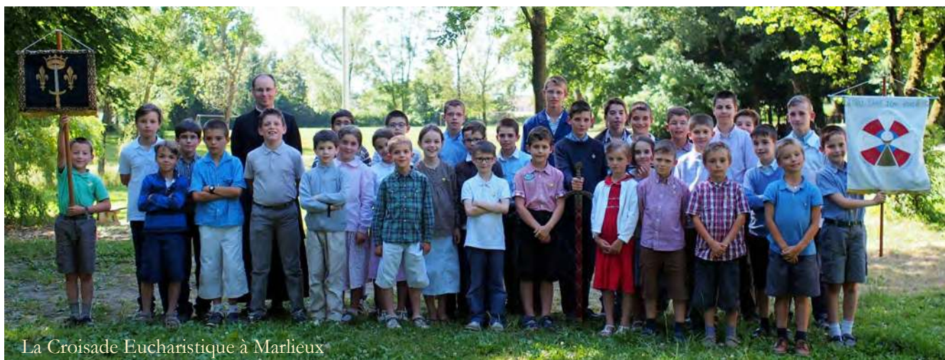
La Croisade Eucharistique à Marlieux

Avec ces jours de septembre synonymes de rentrée, de nouveau départ, renouvelons l'élan de notre ferveur. Nous appartenons tous à l'Église militante, rangée derrière l'étendard de Notre Seigneur Jésus-Christ, et nous devons œuvrer afin de contribuer, à notre place, par nos prières, nos sacrifices et nos exemples, à « tout instaurer dans le Christ ! »