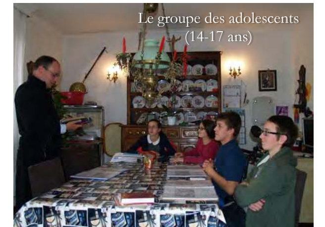
Le groupe des adolescents (14-17 ans)