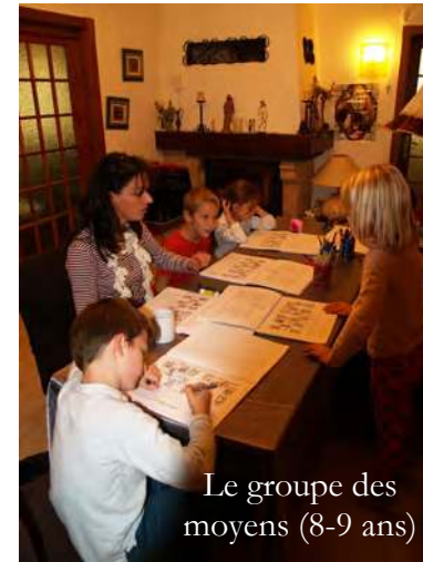
Le groupe des moyens (8-9 ans)