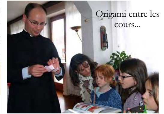
Origami entre les cours...

Toutes les deux semaines, se tient à Metz un cours de catéchisme pour les enfants de la chapelle. 17 enfants de tous âges viennent approfondir leur connaissance de la doctrine chrétienne. Les cours sont donnés par l'abbé et deux mamans et se déroulent le mercredi après-midi, chez la famille Petitjean. Les cours se succèdent de 13h45 à 16h45. Ce jour-là est aussi l'occasion d'une messe à Woippy à 17h30.