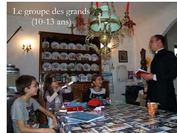
Le groupe des grands (10-13 ans)

Toutes les deux semaines, se tient à Metz un cours de catéchisme pour les enfants de la chapelle. 17 enfants de tous âges viennent approfondir leur connaissance de la doctrine chrétienne. Les cours sont donnés par l'abbé et deux mamans et se déroulent le mercredi après-midi, chez la famille Petitjean. Les cours se succèdent de 13h45 à 16h45. Ce jour-là est aussi l'occasion d'une messe à Woippy à 17h30.