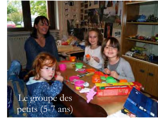
Le groupe des petits (5-7 ans)