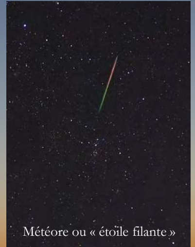
Météore ou « étoile filante »