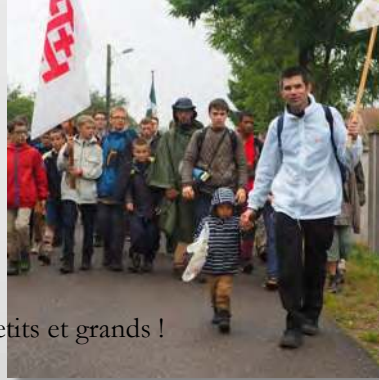
Un pèlé pour petits et grands !