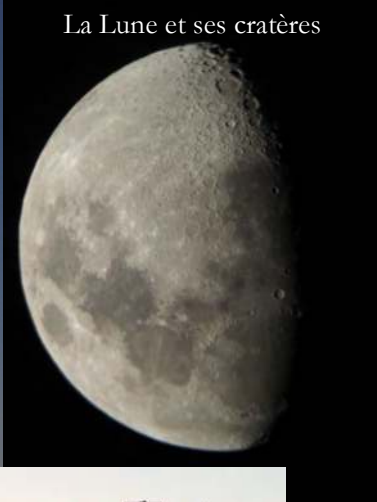
La Lune et ses cratères