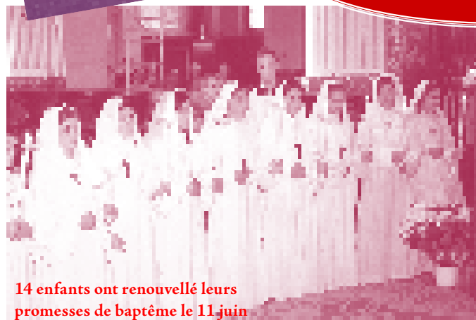
14 enfants ont renouvelé leurs promesses de baptême le 11 juin