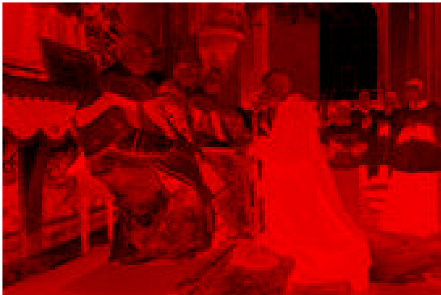
Pendant la cérémonie d'abjuration.

ment, celui d'un homme, qui « après de longues années de lutte et de prière », après avoir connu l'hérésie au cœur de l'Eglise de Luther, choisit de revenir « à l'Eglise fondée par le Christ Lui-même, à l'épouse de l'Agneau immolé », comme il le dira lui-même à ses paroissiens avant de quitter la Suède. « Je retourne à l'Eglise qui fut celle de mes ancêtres d'avant 1517 (...) parce qu'il est nécessaire d'appartenir à cette Eglise pour obtenir le Salut. De même qu'il n'y a qu'un seul Dieu et qu'il n'y a qu'un seul Rédempteur, Notre Seigneur Jésus-Christ, il n'y a également qu'une