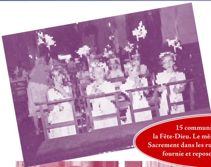
15 communions privées le jour de la Fête-Dieu. Le même jour, procession du Saint-Sacrement dans les rues de Paris avec une assistance fournie et reposoir sur la place de l'Odéon.