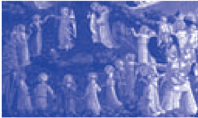
Entre la ronde des saints ou... (Fra Angelico, Le jugement dernier )

Et c'est bien cette impression nouvellement agréable, et au début troublante, qui charme les jeunes. Pour la jeune fille, être dans les bras d'un jeune homme ne pourra que satisfaire une nature prompte aux rêveries sentimen-