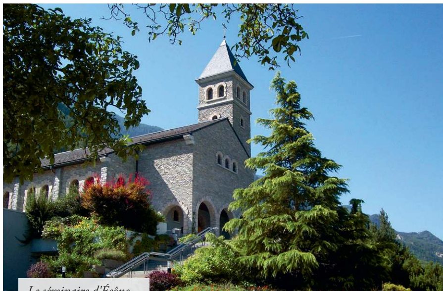
Le séminaire d'Écône

de formation qui connaissait la double secousse du concile Vatican II et de mai 1968.