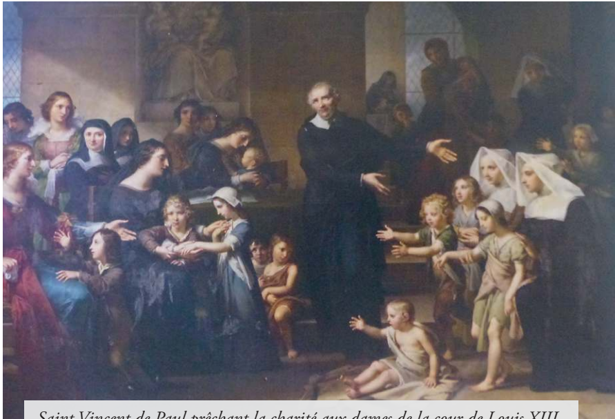
Saint Vincent de Paul prêchant la charité aux dames de la cour de Louis XIII