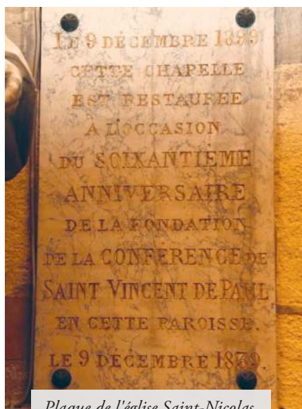
Plaque de l'église Saint-Nicolas