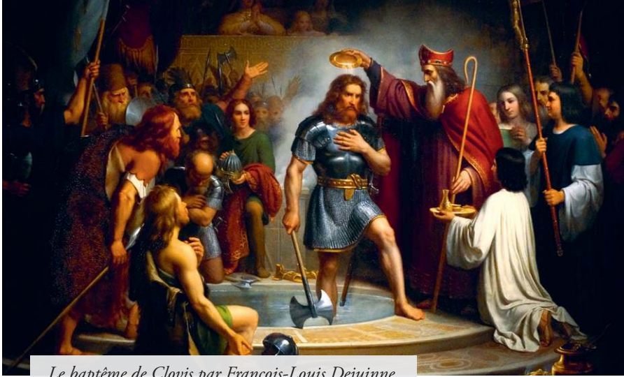
Le baptême de Clovis par François-Louis Dejuinne

et les officiers qui maintenaient à bout de bras les légions ; les évêques regroupaient les populations apeurées : crosse en main, ils parvenaient parfois à arrêter dans ses pillages le Barbare quand même un peu sensible au mystère ! Avec les Huns, ce fut une troupe de bêtes féroces qui déferla et Ætius, maître de ce qu'il restait de la milice romaine, ne serait jamais venu à bout de leur roi Attila, le « fléau de Dieu », si, en 451, sainte Geneviève, vierge consacrée de Nanterre, d'origine mi-franque mi-gauloise, n'avait prié fort et forcé les femmes de Lutèce à se refuser à leurs maris si ceux-ci parlaient de fuir.